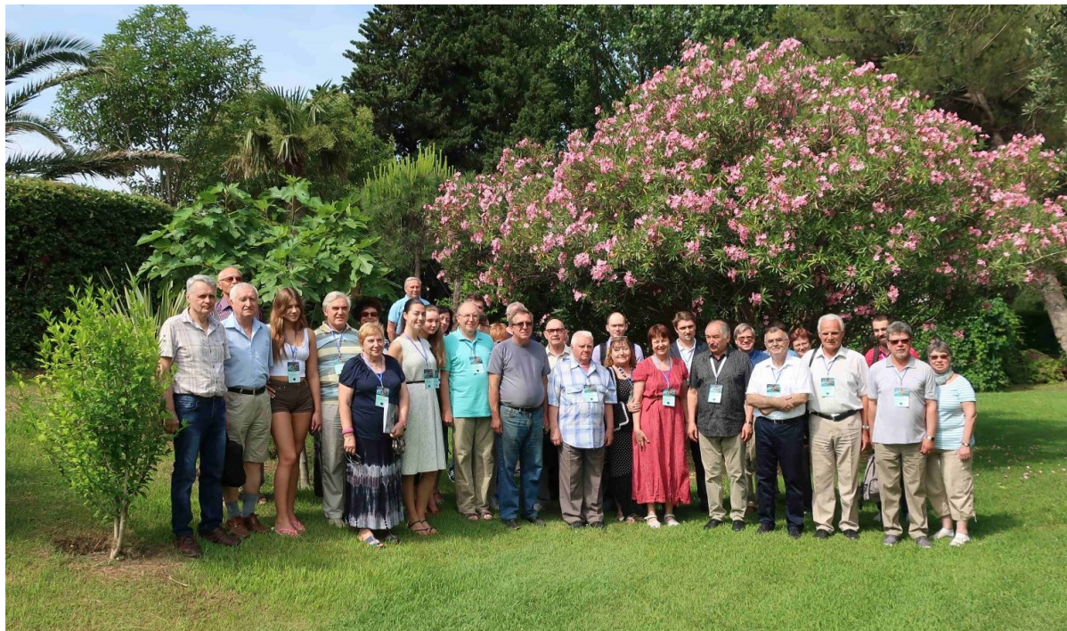
Рис. 1. Участники семинара LPPM3-2018 в день открытия.

математической науки, демонстрирует научному сообществу возможности методологии математического моделирования.