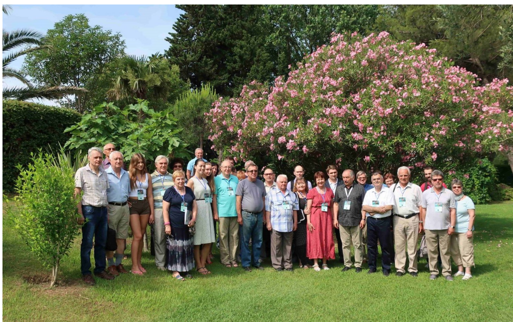
Fig. 1. Participants of the seminar LPPM3-2018 at the opening day.

The seminar traditionally keeps an interdisciplinary focus, based on the scientific methodology of mathematical modeling, which allows to unite scientists working in different subject areas: mathematics, physics, chemistry, biology, medicine, economics, history.